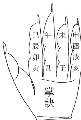
元祿十二年版事林廣記掌圖